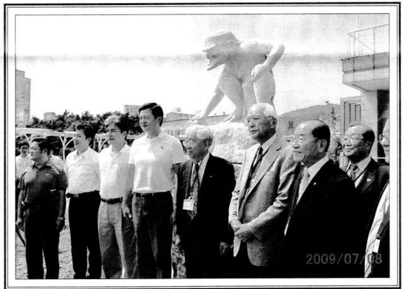
1 ページ関連写真 「河童石像除幕式 at 台北淡水河左岸」にて

近くなると両手を前に突 き出して、救いを求めて 駆け出すような、あるいは 逃げ出すような河童に なった。最後の小説「河 童」は伝説ではなく、自 殺を決意した芥川の精神