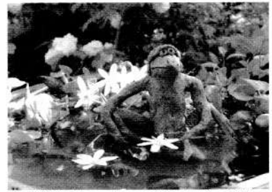
河童世界写真コンクール作品 西井 秋生