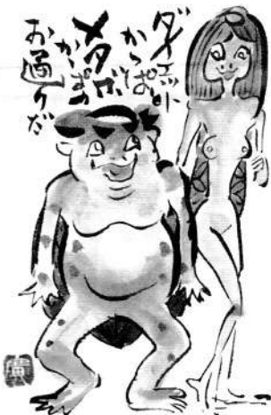
河童絵はがきコンクール作品