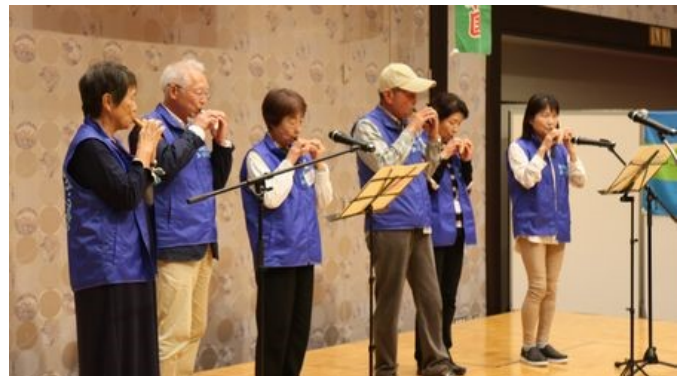
さいたまかっぱ村メンバーによるオカリナ演奏