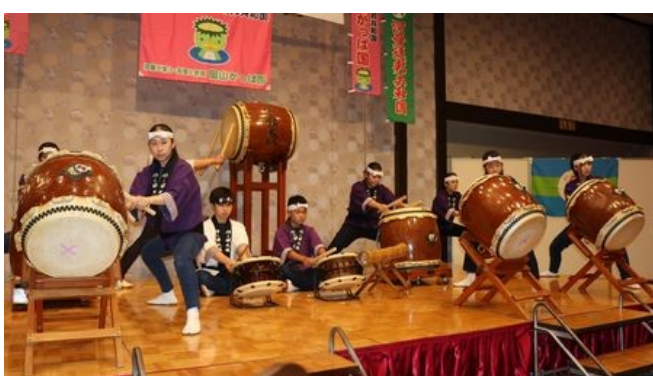
地元太鼓グループによるアトラクション